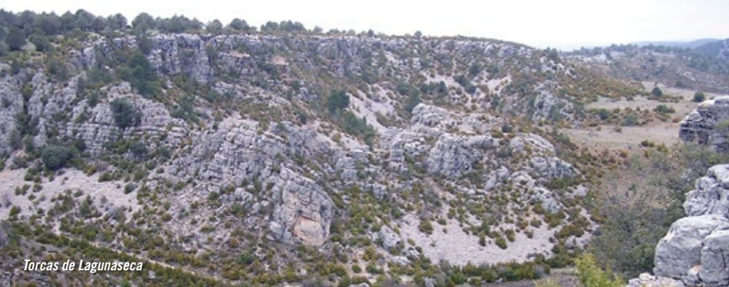
Torcas de Lagunaseca

• EL MONUMENTO NATURAL DE LAS TORCAS DE LAGUNASECA está constituido por un conjunto de formaciones kársticas de elevado interés geomorfológico: depresiones cerradas del terreno, como torcas, dolinas, uvalas y poljés, y otros elementos menores como lapiaces. Además, en las proximidades del pueblo de Lagunaseca, se puede apreciar un anticlinal muy bien desarrollado.