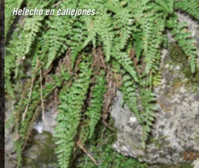
Helecho en callejones

En el M.N. Torcas de Laguna Seca, existe un sendero balizado que en parte de su recorrido coincide con un sendero de pequeño recorrido (PR-CU-02); comienza en el casco urbano de Lagunaseca y recorre las torcas en un recorrido de 7 km.