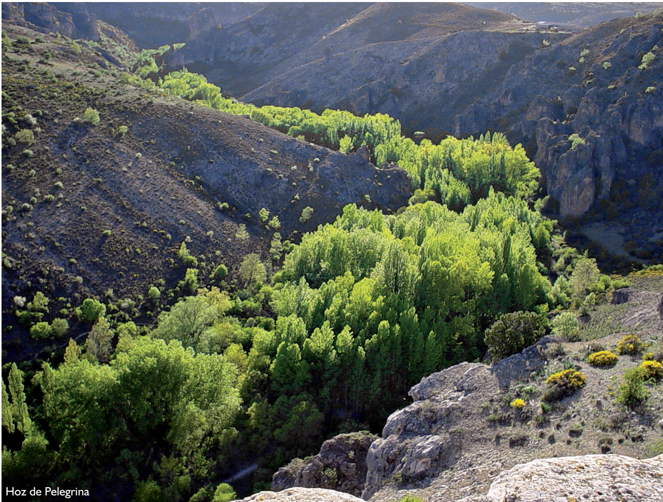
Hoz de Pelegrina

El valle del río Dulce aglutina una gran variedad de hábitat, que contactan entre sí mediante una prolija red de ecotonos, lo que induce una elevada diversidad en su comunidad de vertebrados, inusual para el tamaño relativamente modesto de este espacio natural. Esta diversidad es especialmente notable en el grupo de las aves, y en menor medida en el grupo de los mamíferos. Además de la comunidad de aves rupícolas y ribereñas ya citadas, merece destacarse la diversidad de las comunidades de aves de medios forestales, de sotos, y de matorrales, cultivos y otros medios abiertos. Es también destacable la diversidad de la comunidad de mamíferos carnívoros terrestres de pequeño y mediano tamaño (tejón, gato montés, turón, garduña, comadreja y zorro), y la presencia de corzo y jabalí como ungulados de mayor tamaño.