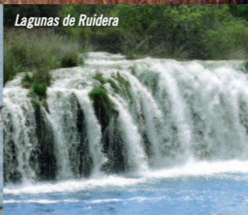
Lagunas de Ruidera