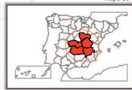
Mapa de situación

Centro de interpretación o Pto de información