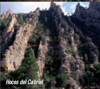
Hoces del Cabriel