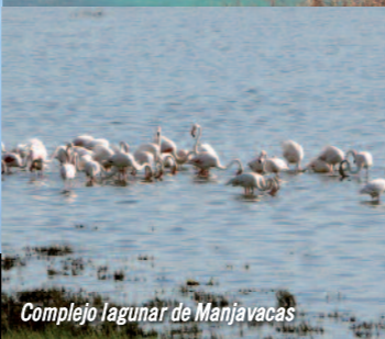
Complejo lagunar de Manjavacas