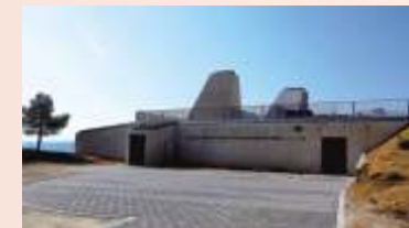
Centro de Interpretación de los Calares

Llegaremos hasta el cruce que lleva al merendero y al antiguo refugio de piedra, que fue utilizado como aula de la naturaleza. Si continuamos sin dejar el asfalto, coronaremos el macizo pasando junto a un pino de gran porte, conocido como el Pino Candelabro.