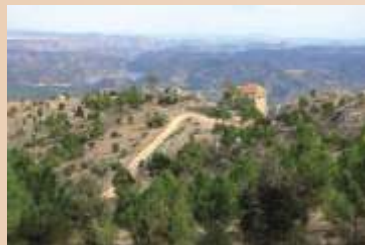
Refugio monte Ardal

Continuamos por la carretera de la izquierda que sube al Ardal, donde también se inicia la ruta cicloturista nº 7, que recorre toda la Microrreserva de Ardal y Tinjarra. La carretera sube junto al arroyo de la Celada. El monte que se muestra ante nosotros no deja de ser curioso: el viejo pinar maderero que el Ayuntamiento de Yeste aprovechaba dio paso, tras el incendio, a un monte bajo rico en especies donde predominan la carrasca, el roble y los serbales, antiguas variedades autóctonas que dan nombre a este monte. Entre el matorral de coscojas, romeros y jaras merodean liebres, conejos y zorros y no es raro ver algún águila culebrera en época de anidación.