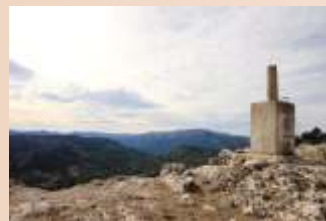
Vértice Geodésico Monte Ardal

Monte Ardal es un pequeño monte de utilidad pública (M.U.P. nº 90) que, situado en el centro geográfico del municipio y a espaldas de su casco urbano, pertenece al Ayuntamiento de Yeste. Fue productor de madera y pastos antes del incendio de 1994. En 2005 fue incluido junto a monte de La Florida y Tinjarra dentro de la Microrreserva de Ardal y Tinjarra, con 2138 hectáreas protegidas.