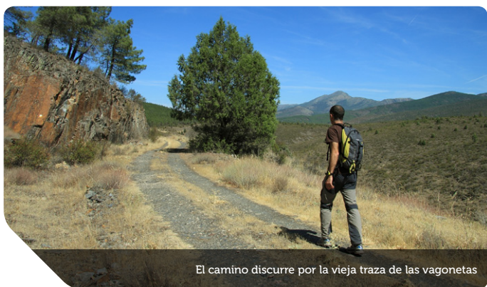
El camino discurre por la vieja traza de las vagonetas

Poco a poco el camino va rodeando la colina adentrándose en un frondoso pinar hasta que un jalón desvía el camino hacia un cortafuegos, iniciándose una trepidante bajada en la que el senderista deberá poner los cinco sentidos para no resbalar. Desde lo alto, a la derecha, se divisa una bonita postal con la Casilla de la Vistosa en la colina en primer plano, el Gran Ocejón de fondo y el profundo azul del cielo como cierre.