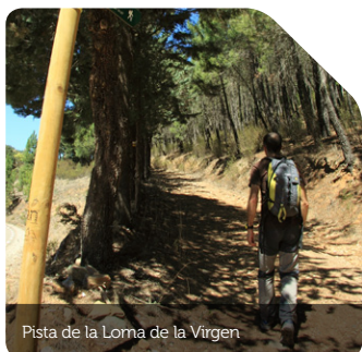
Pista de la Loma de la Virgen

re un suave perfil de colinas a través de un monte adhesionado de encinas y carrascas en el que el caminante, con la silueta de Tamajón dibujándose en el horizonte, apresurará el paso, no sin antes hincharse del embriagador aroma de cantuesos, romeros y aliagas que le acompañarán hasta la misma entrada del pueblo.