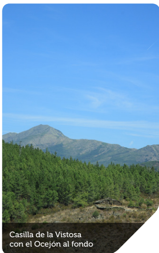
Casilla de la Vistosa con el Ocejón al fondo

Se desciende hasta el fondo de la vaguada hasta encontrar la junta del Arroyo de la Virgen con el Arroyo de las Hoces que se atraviesa sin mayor problema. Un jalón, colocado junto a una torre de luz, indica la dirección hacia el canal artificial que forma parte de las infraestructuras de la propia presa de El Vado.