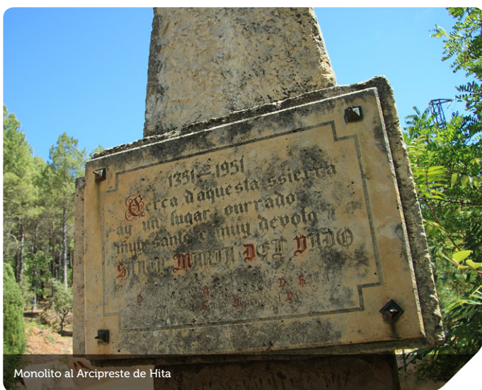
Monolito al Arcipreste de Hita

Ya en el páramo, poco a poco, hacia levante, el camino reco-