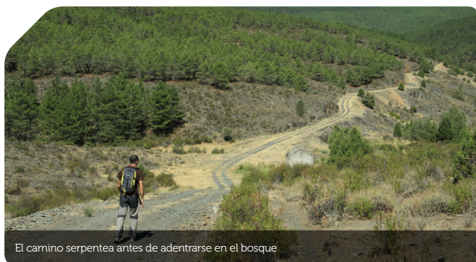
El camino serpentea antes de adentrarse en el bosque

Junto a la fuente del pueblo se ubica el panel de inicio de ruta donde se encuentra el mapa con las indicaciones del PR-GU03 llamado Camino del Arcipreste pues tiene como destino un pequeño monolito levantado en recuerdo al Arcipreste de Hita que, según relata en El Libro del Buen Amor , terminó su viaje orando en el santuario de Nuestra Señora de El Vado, anegado tras la construcción de la presa de El Vado en 1954.