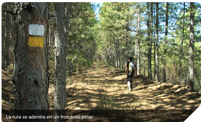
La ruta se adentra en un frondoso pinar

contempla un interesante panorama: hacia el sur se divisa la cantera, ahora abandonada, otrora febril centro de canteros, artesanos de los sillares de la presa de El Vado; hacia el noreste se dibuja Tamajón y, a poniente, el camino del senderista, un extenso bosque de pinos coronado por las cumbres de la Sierra de la Puebla.