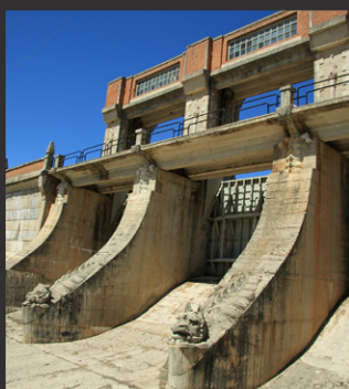
Dique sur de la presa de El Vado