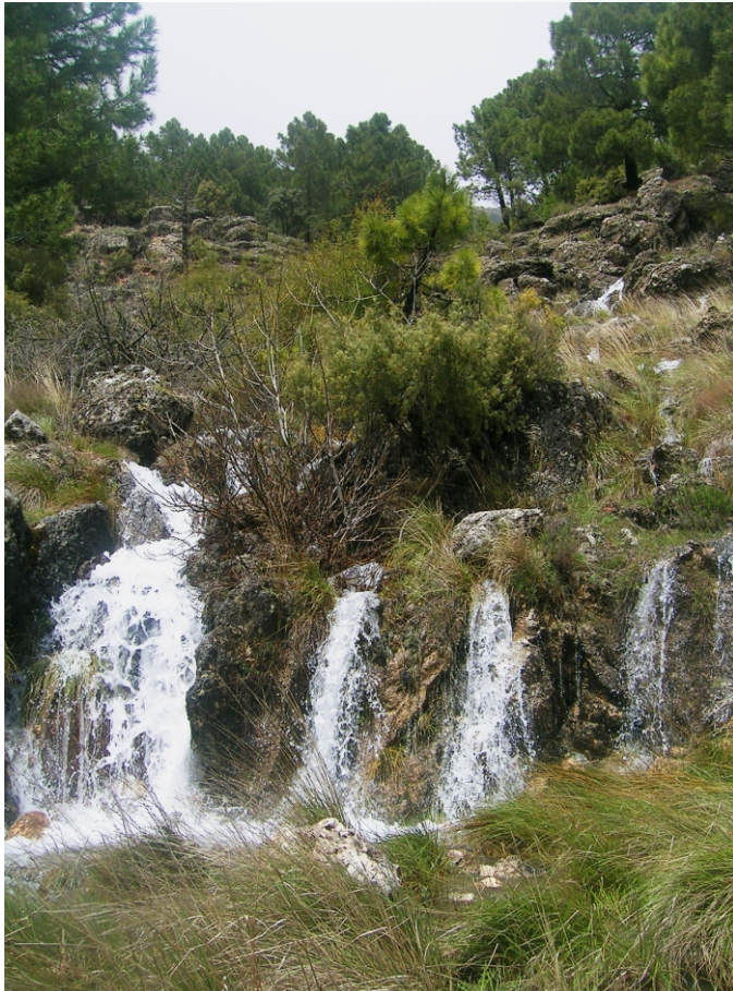
Entre pinos , arroyos y aldeas.