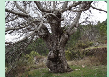
Nogal centenario en Arroyo Frio

A partir de aquí coincidimos con el GR 68, denominado Circular de la Sierra del Segura. Nuestro recorrido nos lleva carretera abajo hasta tomar un antiguo carril de saca de madera que sale a la derecha. A 650 m nuestro carril vuelve a convertirse en estrecha senda que debemos seguir hasta atravesar el barranco de Arroyo Frio . Nos encontraremos enseguida con una bifurcación. Tomaremos el carril que se queda un poco mas alto por la derecha, y lo seguimos hasta salir a la carretera de la Parrilla que se encuentra a 530 m.