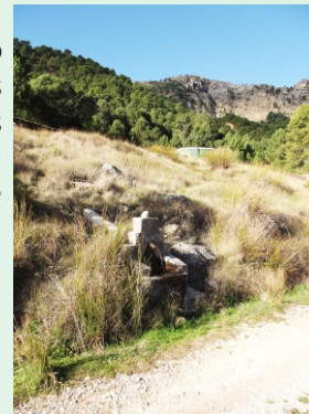
Fuente de la Quebradas