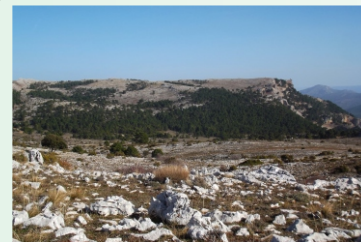
Calar del Mundo

A un lado tenemos el gran desfiladero del Infierno que forma el río tus y las vertientes del Calar de la Sima y del Mundo, a su paso entre las tierras andaluzas y manchegas, y a nuestra espalda al fondo se divisa la parte mas oriental del Calar del Mundo y el cerro Argel (1698m). Pronto llegaremos a una zona de canchales o acumulación de piedras sueltas originados por el deshielo, que cruzaremos. A partir de aquí la vegetación comienza a cambiar, el bosque de pinos deja paso a un matorral más de montaña, con espinos, enebros, carrascas y donde no es raro encontrarnos con el vuelo del buitre leonado.