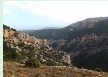
Desfiladero río Tus

Desde la aldea de las Lagunicas continuaremos dirección a la Lastra, por la carretera que deja de ser asfaltada una vez cruzado el arroyo de los Marines y llega hasta el cortijo de la Lastra como pista Forestal. Ya en la Lastra en el cruce de acceso la pista que tomaremos para nuestro destino será la de la izquierda, y a pocos cientos de metros cogeremos una senda que nos llevará través del pinar hacia el calar.