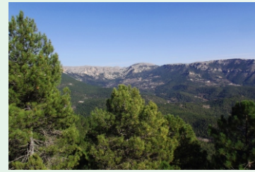
Vistas Calar del Mundo. Al fondo cerro Argel

Desde la aldea de las Lagunicas en el Hueco de Tus se inicia la subida de esta ruta. Parte del recorrido pertenece a la red de caminos pecuarios tradicionalmente ligados a la actividad de la trashumancia o traslado a pie del ganado entre los pastos de invierno y los de verano, es la Vereda de Siles, parte se encuentra empedrado, marcando el trazado exacto de la vereda.