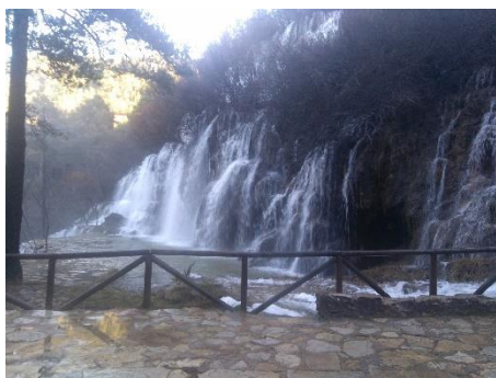
Cascada del Nacimiento del río Cuervo