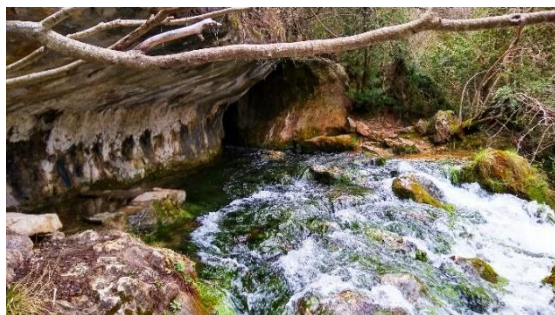
Nacimiento del río Cuervo.