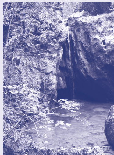
ARROYO DEL HORCAJO

Disfrutaremos de una preciosa vista del barranco, así como del cañón principal del Tajo. También podremos contemplar el vuelo de los buitres leonados y con suerte podremos ver algunas de las aves rupícolas que viven en los cortados, como el halcón peregrino, el águila real, el alimoche y el roquero solitario. Se recomienda el uso de prismáticos para poder apreciar toda esta biodiversidad.