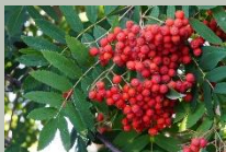
Serbal de cazadores