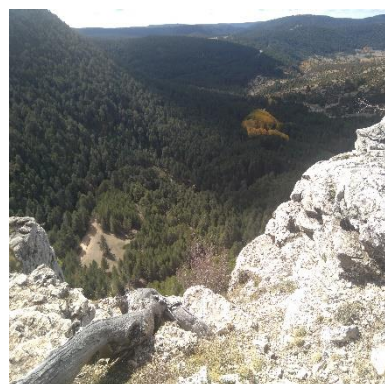
Mirador del Cuervo