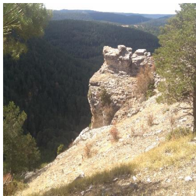
Mirador del Cuervo