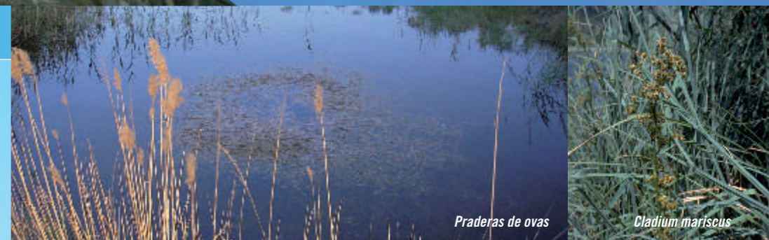
Praderas de ovas