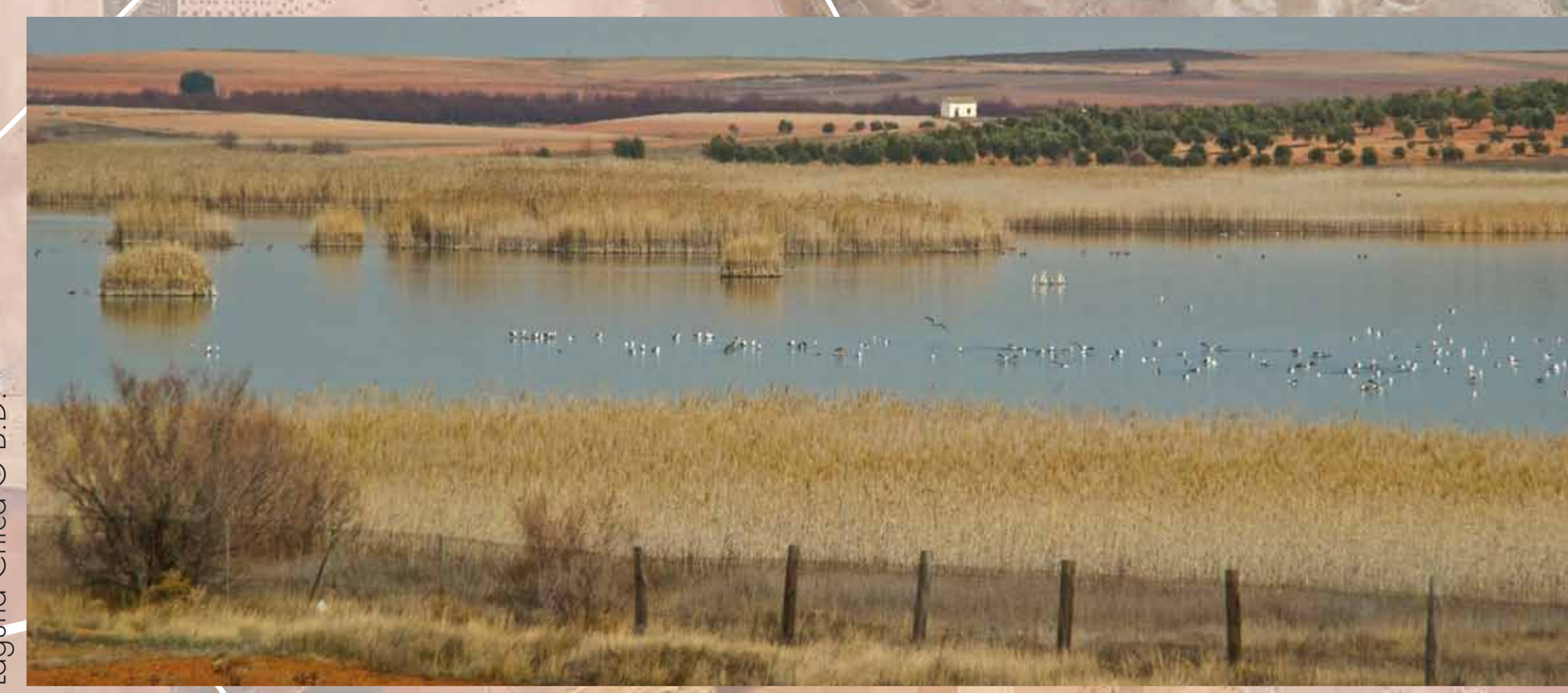
Laguna Chica

Una ruta a pie y otra en bicicleta permiten disfrutar del entorno sin generar molestias medioambientales.