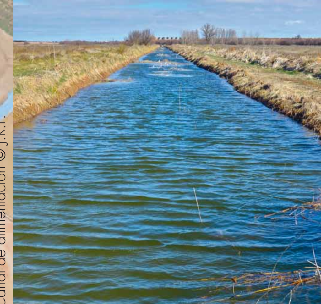
Canal de alimentación

Zona de Especial Protección para las Aves (ZEPA)